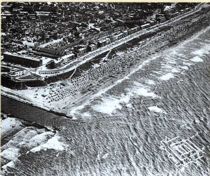
De Brittenburg is hier op een luchtfoto van Katwijk ingetekend, maar of het castellum daar werkelijk ligt is nog maar de vraag.