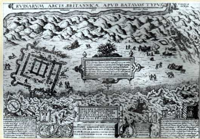
De Brittenburg op de kaart van Ortelius. De zee drong later op tot waar op de kaart de duinenrij ligt.

tikel uit 1960 over de speurtocht door de leden van de Onderwater Jagers Club (OJC) staat dat er zich mensen melden die beweren dat ze de Brittenburg aan het begin van deze eeuw nog uit de branding hebben zien oprijzen: «Op een winderige dag in 1923» zo vertelt een Amsterdammer, «wandelde ik op het strand bij Katwijk, toen ik plotseling restanten van een oud bouwwerk aan de oppervlakte zag komen. De geschiedenis van het verzonken Romeinse castellum was mij toen niet bekend, maar nu er de laatste tijd zoveel over wordt geschreven, begin ik te geloven dat ik de restanten van de verdwenen burch heb gezien». Een andere briefschrijver deelt mee, dat hij in 1910, toen hij als militair met een detachement van vierduizend man nabij Katwijk was gelegerd, brokstukken van een soort kasteel onder de waterspiegel zag liggen. Een dame uit Leiden verhaalt dat zij de Brittenburg uit het water zag