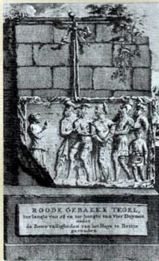
Links: Een tegel uit de ruïne van de Brittenburg, gevonden in Katwijk en nu ingemetseld in het portaal van Slot Duyvenvoorde in Voorschoten. Rechts: Een fantasie van de schilder Rochussen: Een Bataafse marktplaats aan de Rijnmond, met op de achtergrond de Brittenburg.

Maar er zijn tekenen, die erop wijzen, dat de ruïne zich inderdaad nog op de zeebodem bevindt. Verscheidene Katwijkse vissers zijn in de loop der jaren op brokstukken gestoten en hebben hun netten erop verspeeld. Ook is er de verklaring